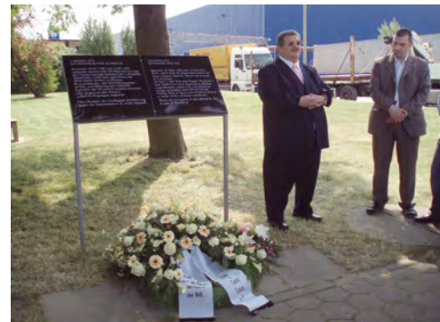
Der ehemalige Vorplatz des Hannoverschen Bahnhofs.