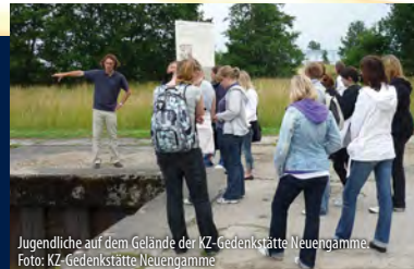
Jugendliche auf dem Gelände der KZ-Gedenkstätte Neuengamme.