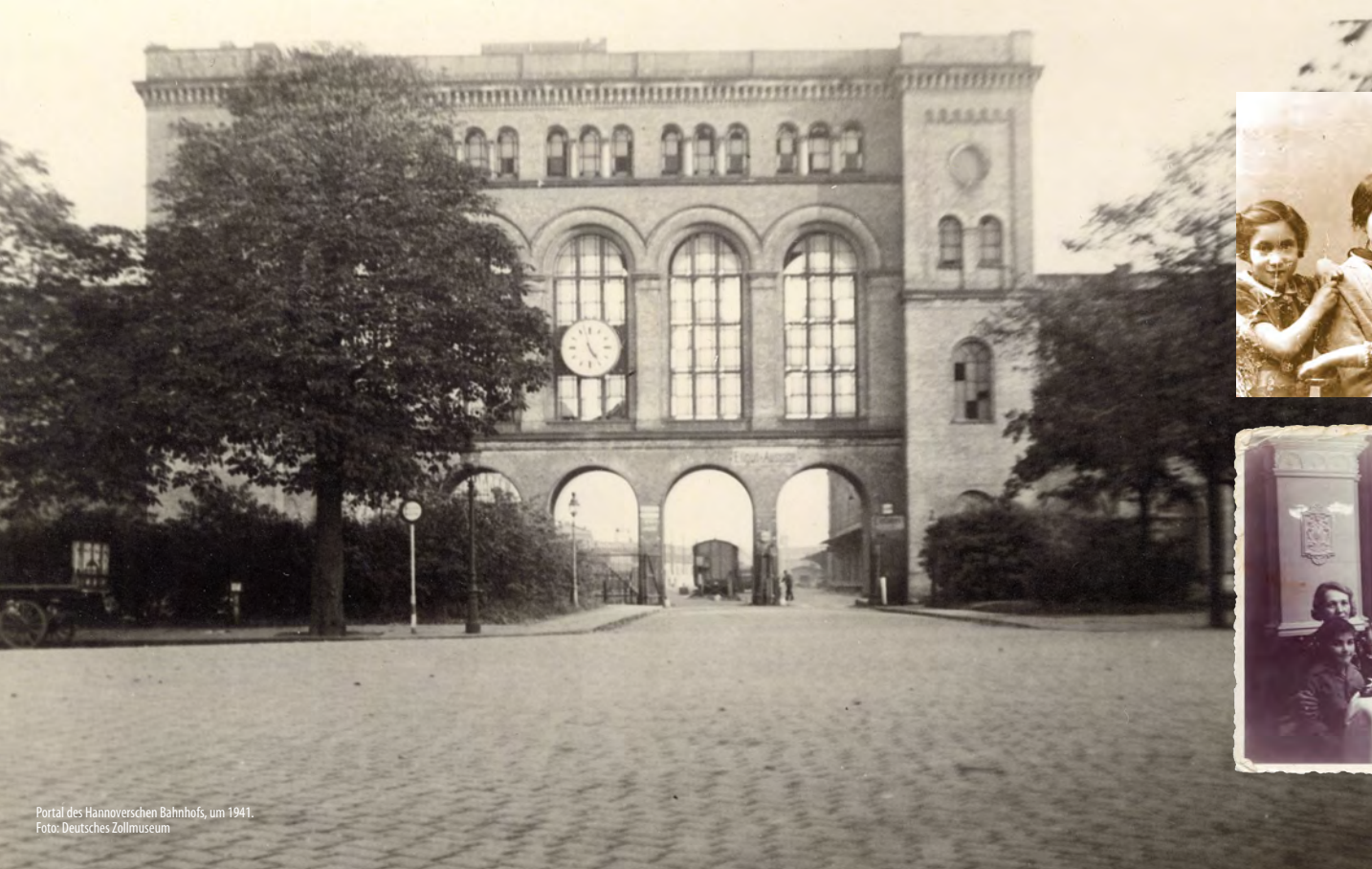
Portal des Hannoverschen Bahnhofs, um 1941.