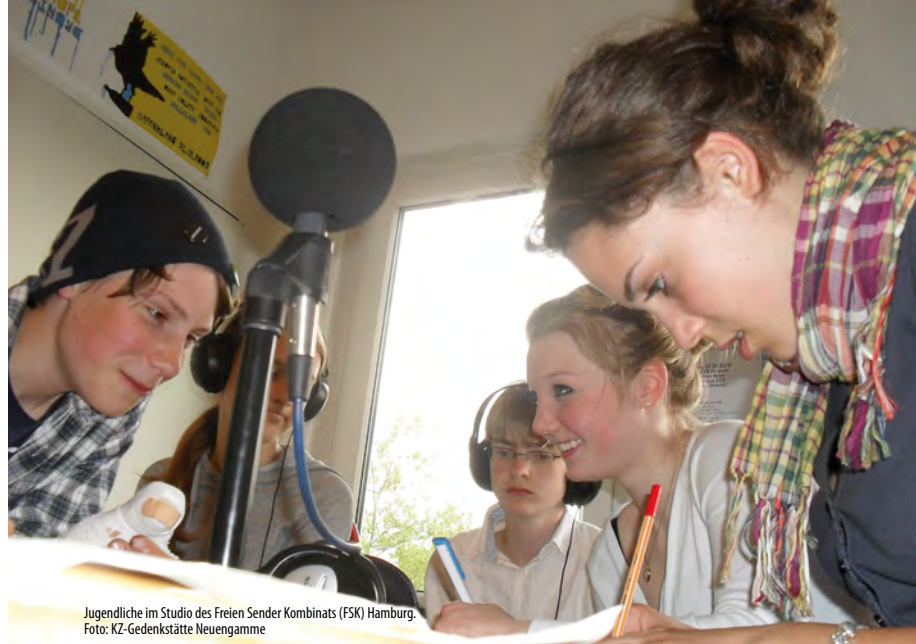
Jugendliche im Studio des Freien Sender Kombinars (FSK) Hamburg.