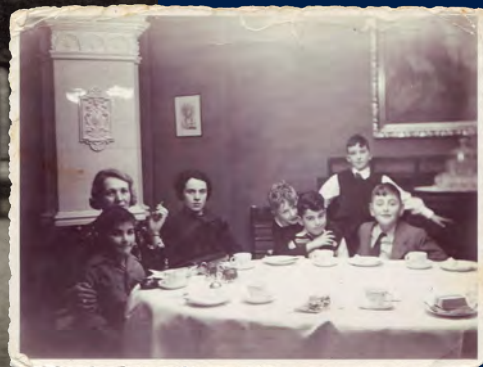
Kindergeburtstag bei Familie Phillip, im November 1941 ins Ghetto Minsk deportiert.