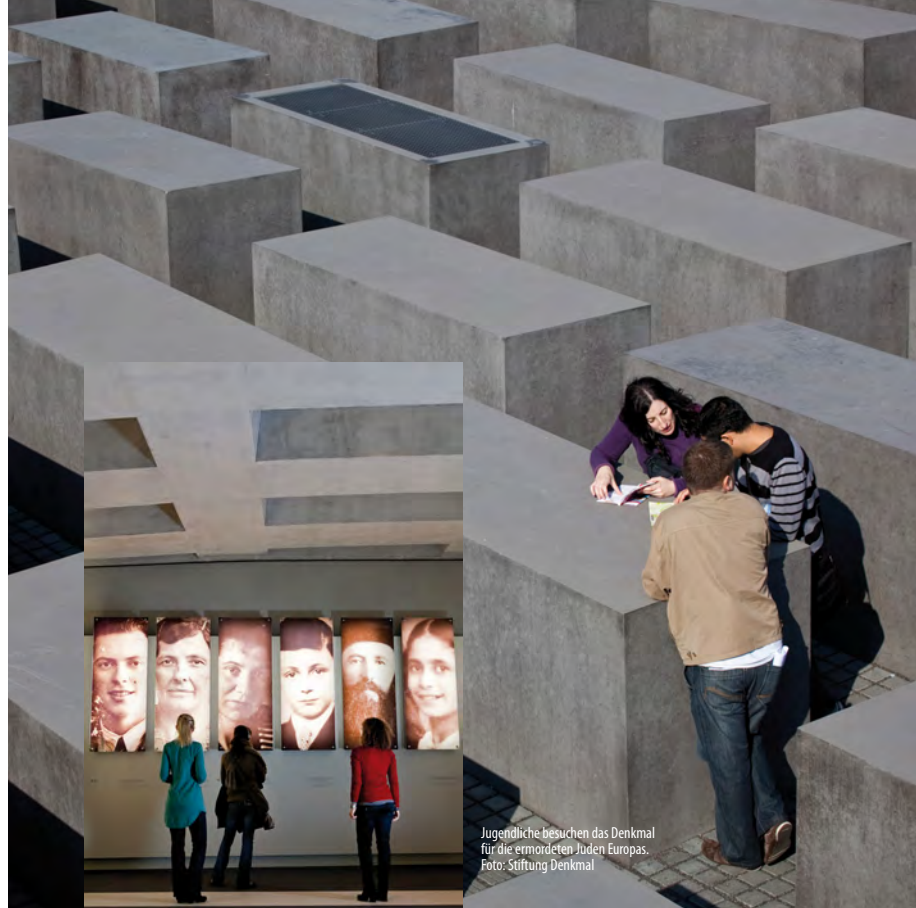
Jugendliche besuchen das Denkmal für die ermordeten Juden Europas.