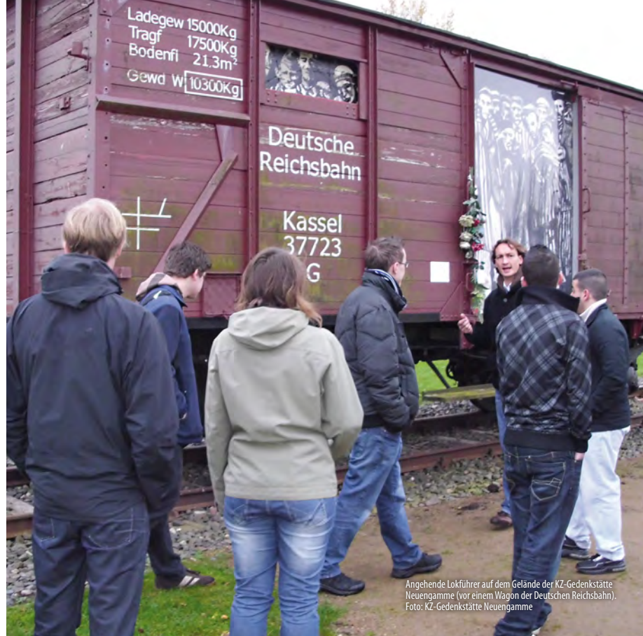
Angehende Lokführer auf dem Gelände der KZ-Gedenkstätte Neuengamme (vor einem Wagon der Deutschen Reichsbahn).